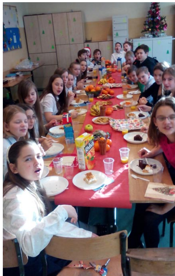
świąteczne spotkanie w klasie V e