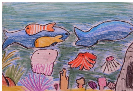
Paulina Skutecka (klasa IV a)