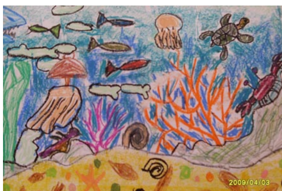
Łukasz Chmielowski (klasa IV a)