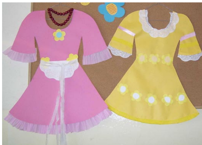
„Radość o poranku” A. Gabryliszyn