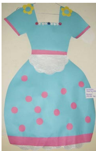
„Błękitny obłoczek” K. Rek