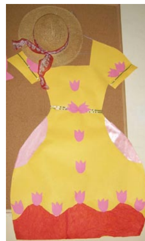
„Wiosenny promień słońca” H. Belczyk