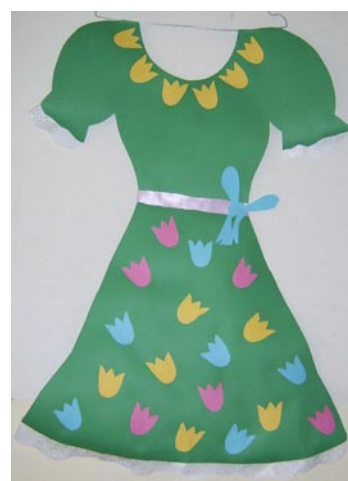
„Wiosenny ogród” J. & A. Kozłowski