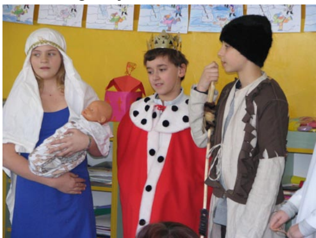
U nas w szkole

W naszym kraju co roku po świętach Bożego Narodzenia chodzą po domach kolednicy. Dawniej dzieci śpiewały, żeby dostać parę groszy lub cukierki. Dzisiaj robimy to dla podtrzymania tradycji. Mali aktorzy świąteczni przebierają się za postacie, które występują w jasełkach. Charakterystycznymi postaciami w grupach koledniczych są: pasterze, Trzej Królowie, Dziad, Baba (przebierają się również chłopcy), Żyd, Cyganka, muzykan-ci. Życzenia składa się wierszem albo koledą, płata się przy tym figle, recytuje zabawne rymowanki, a całemu widowisku towarzyszy atmosfera ogólnej wesołości.