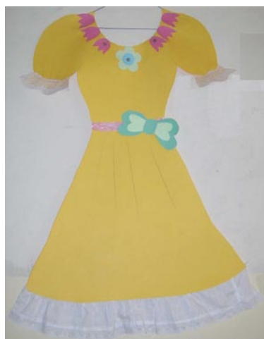
„Wiosenne orzeźwienie” M. Wiśniewska