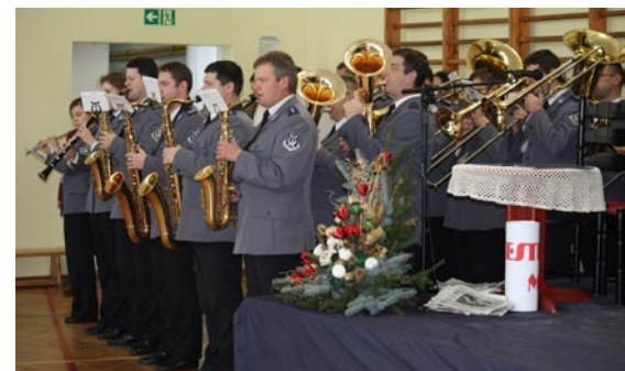
Nasz jubileusz uświetniła orkiestra policyjna.