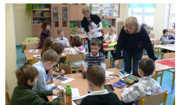
W sobotę 11 grudnia miały miejsce warsztaty poświęcone historii Wrocławia, Muchoboru Wielkiego, naszej szkoły. Młodzi uczniowie wykonywali także ozdoby bożonarodzeniowe