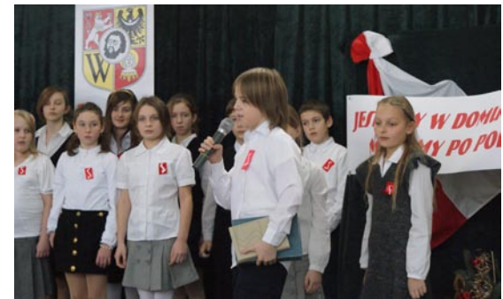
Spektakl uczniów klas IV-VI poświęcony patronowi naszej szkoły.