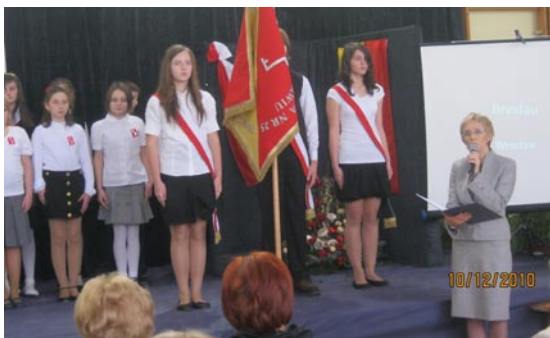
Pani dyrektor wita zaproszonych gości.