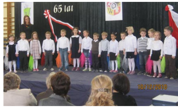
Występ naszych przedszkolaków. Przedszkole Nr 11 już ma roczek.