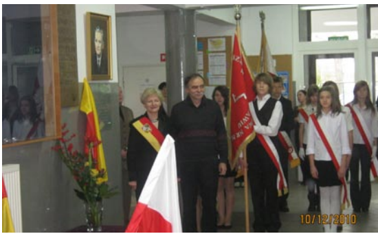
Uroczyste odsłonięcie pamiątkowej tablicy poświęconej naszemu patronowi.