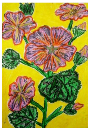
Natalia Zając (klas VI c)