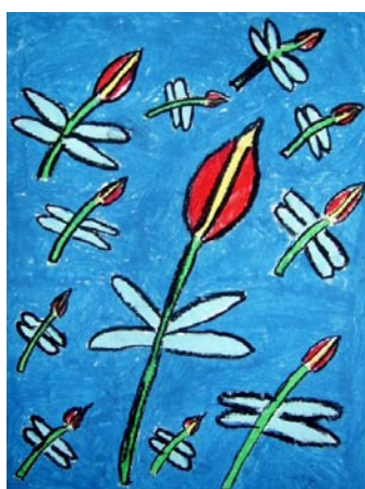
Paweł Moroz (klas VI c)