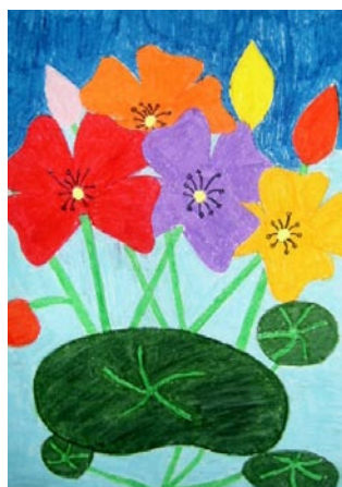
Natalia Kowalska (klas VI c)