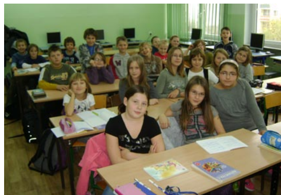
klasa IV b w sali P3