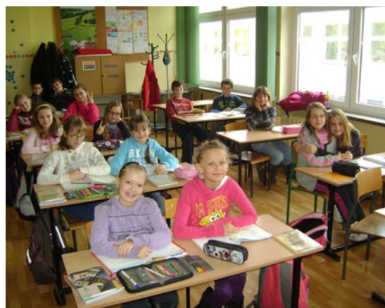
klasa V a w sali P2