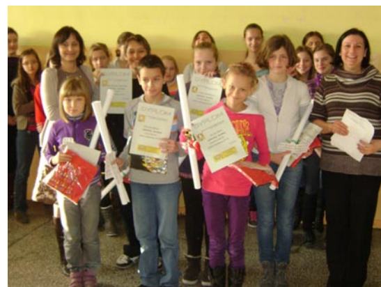
apel z okazji Dnia Życzliwości