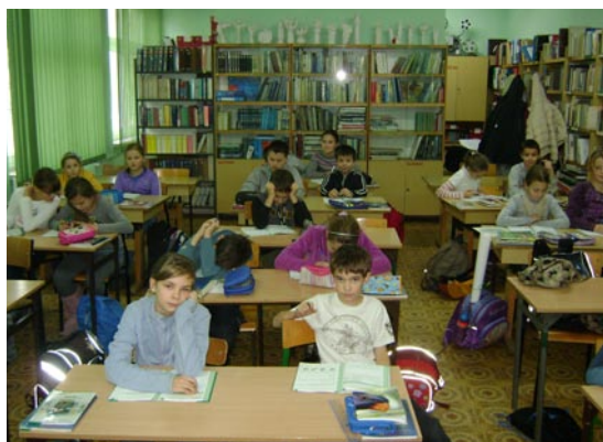
klasa IV a w czytelni