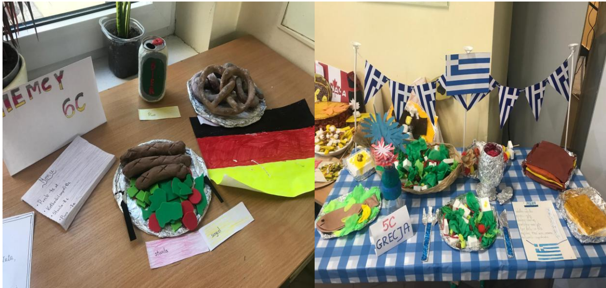
FOTO RELACJA Z MIĘDZYNARODOWEGO DNIA JĘZYKÓW OBCYCH